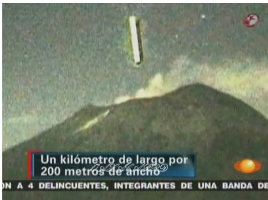
Скриншот №1 По мнению авторов новостного сюжета «Объект имел в длину около километра, а в ширину двести метров»