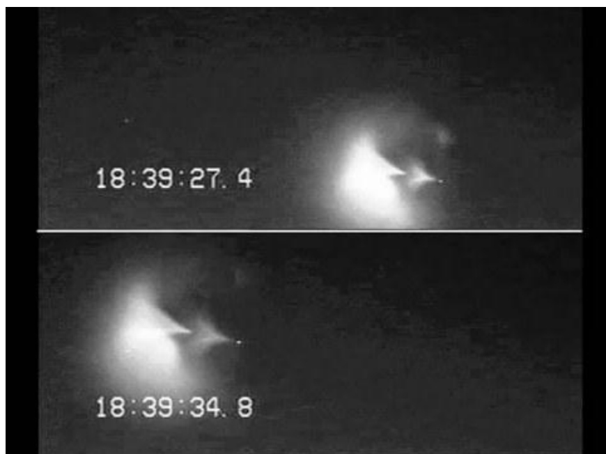
Десятки жителей Кейптауна наблюдали в небе «НЛО»

11 декабря 2012г. с космодрома Космического центра им. Д.Ф.Кеннеди (мыс Канаверал, США) состоялся пуск ракеты-носителя «Атлас-5» («Atlas V») с беспилотным летательным аппаратом X-37B. Военно-воздушные силы США успешно вывели на орбиту свой беспилотник . Информация о том, какие задачи будет выполнять X-37B строго засекречена. Пуск ракеты-носителя «Атлас-5» с беспилотным летательным аппаратом X-37B.