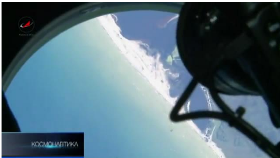
Выбросы метана на поверхности воды

Сергей Кудь-Сверчков , космонавт-испытатель