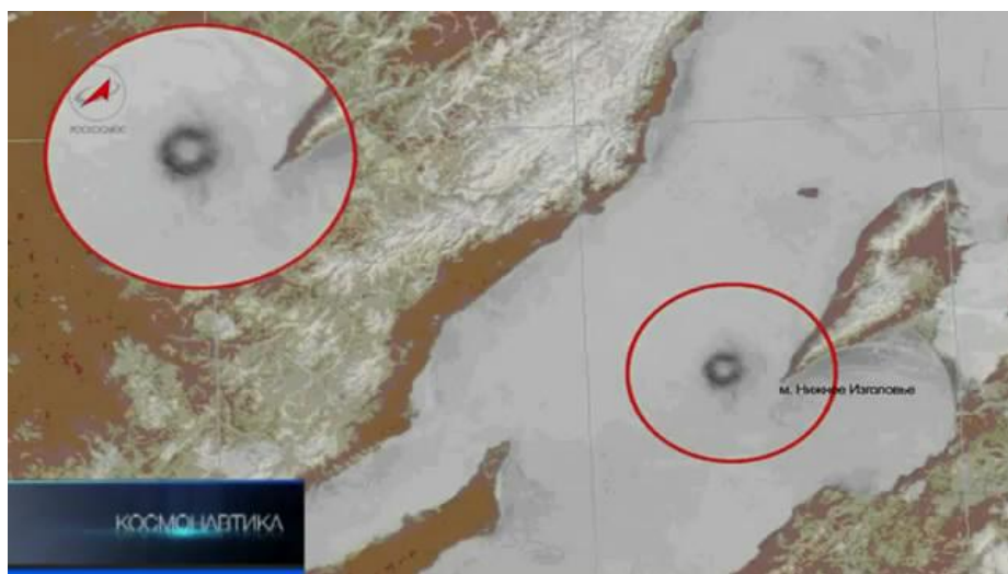
«Фотосессия над Ольхоном»