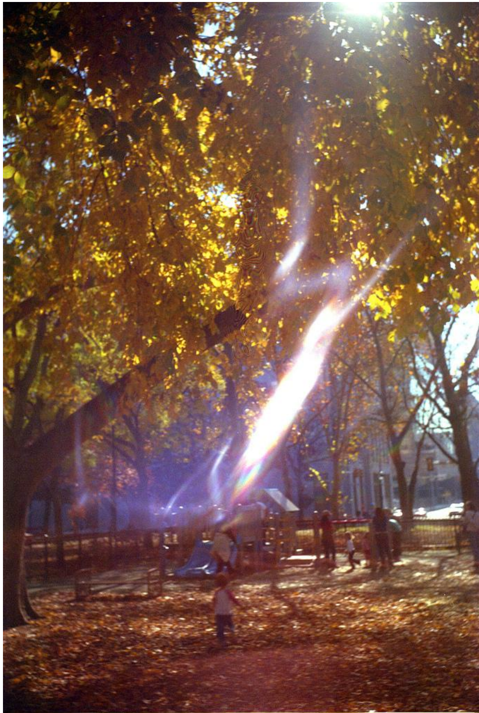
Рис. 5. Пример №2.

Мне кажется что второе фото фотографии. Т.е. фотоаппаратом переснято бумажное фото, на котором запечатлен этот эффект. В верхней части фото есть отражение как от матового глянца фотобумаги.