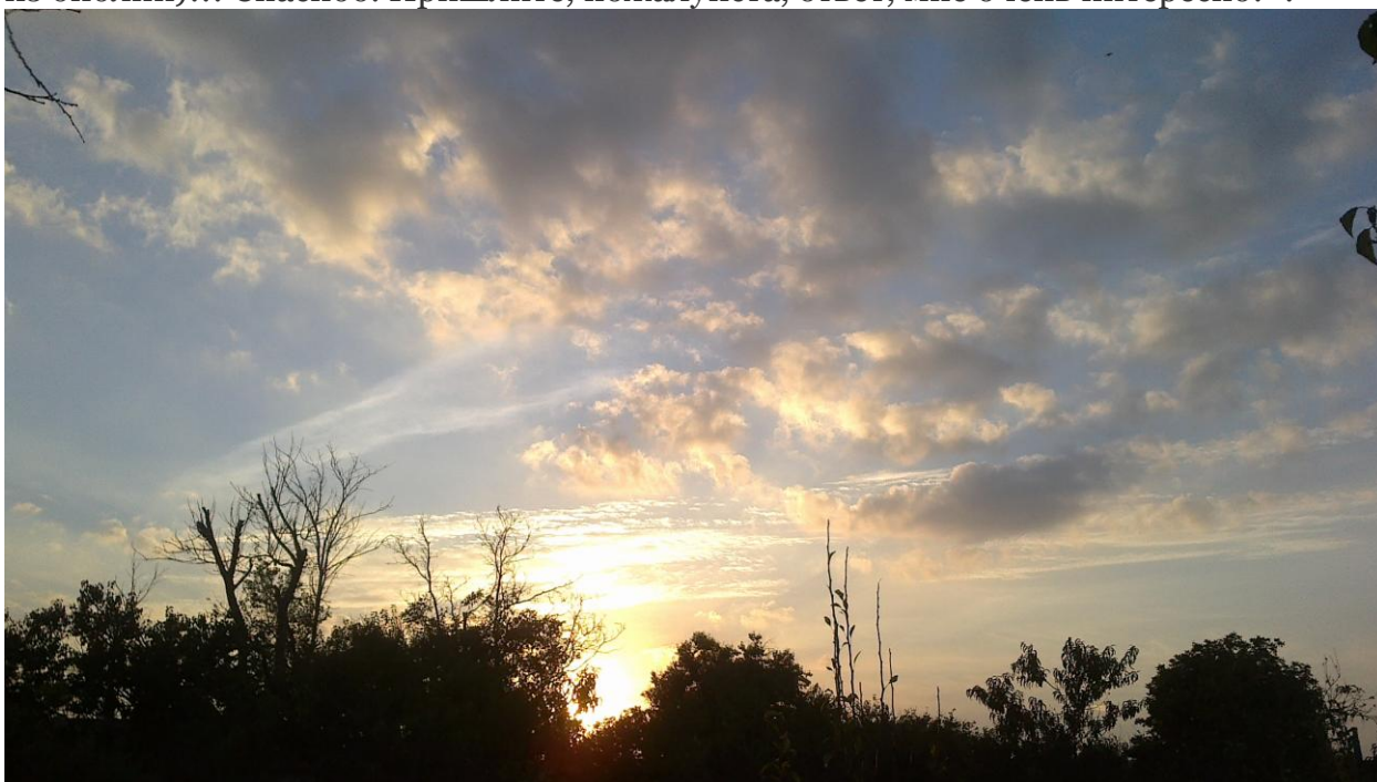
Рис. 1. Первое фото.

«Где я сняла небо, смотрите, пожалуйста, в правом верхнем углу чёрный объект! Чтоб рассмотреть его, нужно увеличить...!!! И скажите, пожалуйста, что у меня находится на солнечном сплетении? Луч света, а в нём меч... (обоюдоострый меч... из библии)!!! Спасибо. Пришлите, пожалуйста, ответ, мне очень интересно!».