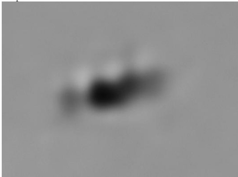
Рис. 3. Объект увеличен.

На первом снимке с вероятностью 95% запечатлено насекомое, размазанное по траектории полета за счет скорости движения. Видны несколько следов от взмахов его крыльев.