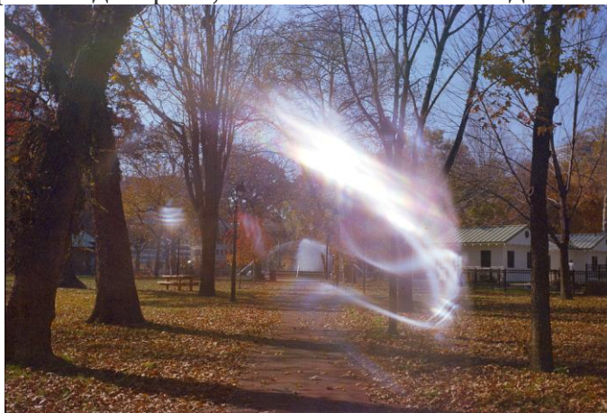
Рис. 4. Пример №1.

По поводу второго фото - есть вероятность того, что это блик света в линзах фотоаппарата. В таком случае рядом должен был быть источник света. Как пример такого эффекта - два фото, снятых в солнечный день.