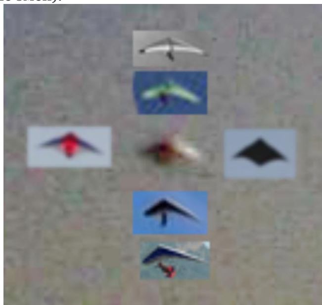
Рис. 3. Сравнение с дельтапланами (справа и слева от объекта - воздушные змеи).

Я пока не уверен, что это дельтаплан. Такое впечатление, что освещенный край объекта слишком «толстый» для дельтаплана, чтобы он так отражал свет. Как будто это что-то надутое. См. моё сравнение с дельтапланами (справа и слева от объекта - воздушные змеи).