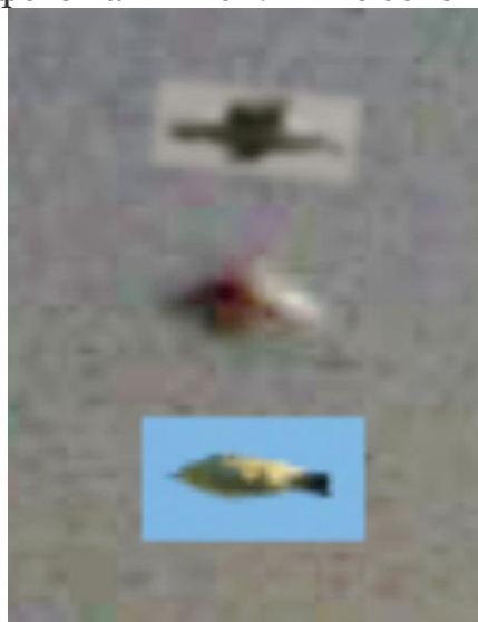
Рис.4. Фото чайки.

В таком случае выпуклость вверху и внизу может быть объяснена крыльями. Для сравнения, я использовал фото чайки - см. выше объекта.