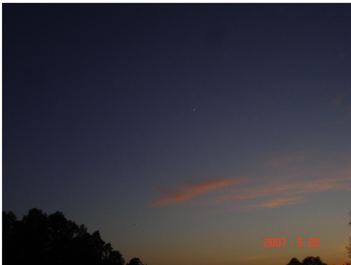
Рис. 1. НЛО в районе реки Протва. Фото присланное очевидцем.