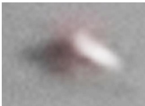
Рис. 5. Под «крылом» находится нечто неправильной формы с различными выступами.

«Толстое» крыло - кажущийся эффект из-за его яркости. Кроме того, у Вас увеличение проведено не самым корректным образом - сначала нужно по максимуму подавить цифровые шумы и артефакты сжатия, а уже потом наращивать размер изображения и dpi с нужным алгоритмом. При этом подходе видно, что под «крылом» находится нечто неправильной формы с различными выступами (скорее всего - рамы, стропы, торчащие ноги и т.п.). См. фото.