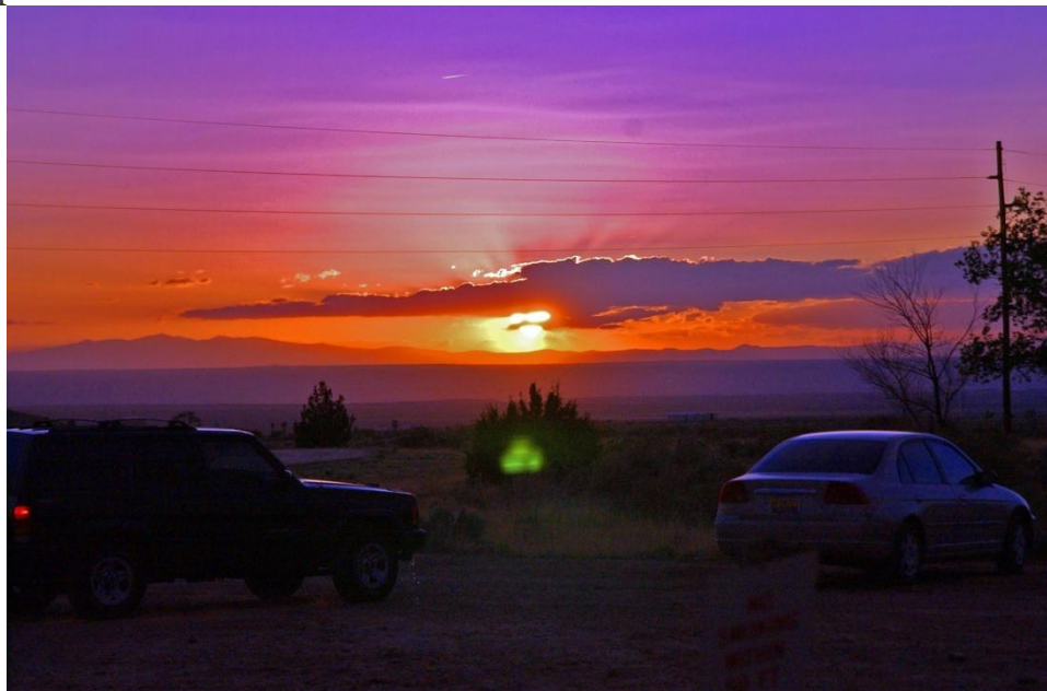
Рис. 2. Солнечные блики.

Для примеров. На этом фото есть что-то похожее: