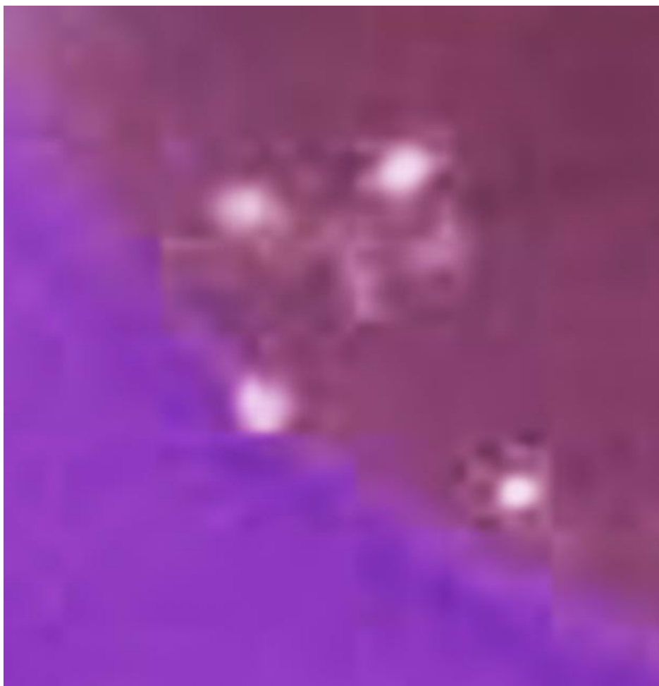
Рис. 1. Увеличение фото.