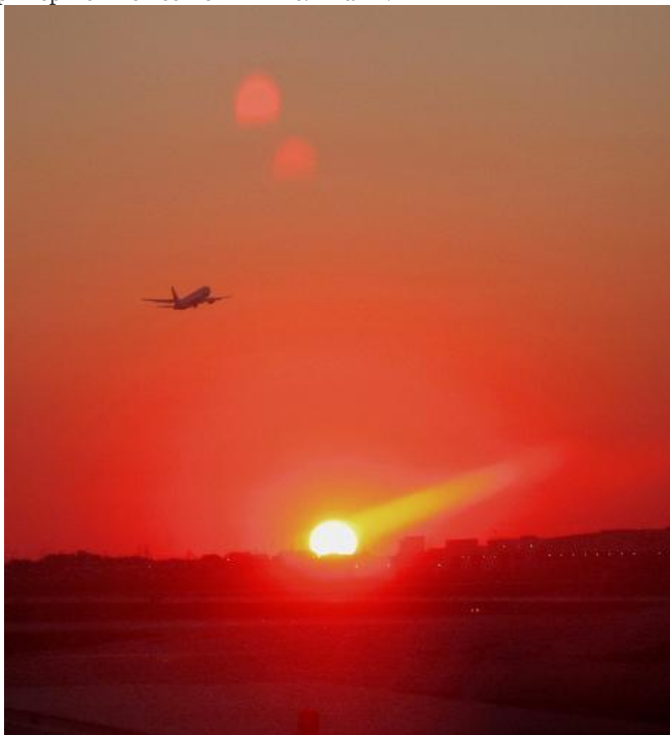
Рис. 3. Солнечные блики.

Другие примеры с множественными бликами: