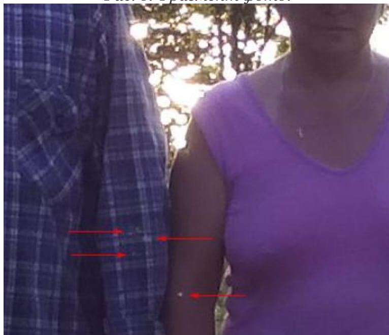
Рис. 7. Фрагмент фото.