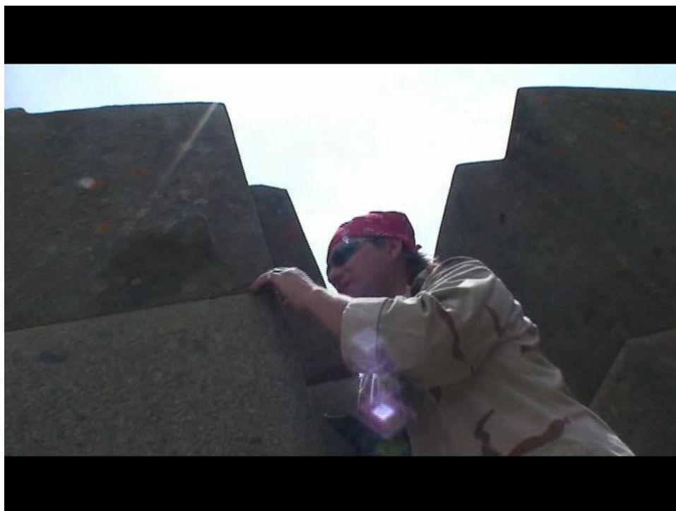
Рис. 4. Солнечные блики.