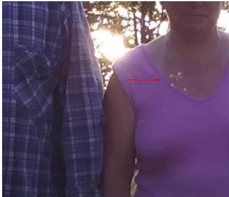
Рис. 8. Анимация из фрагментов фото.