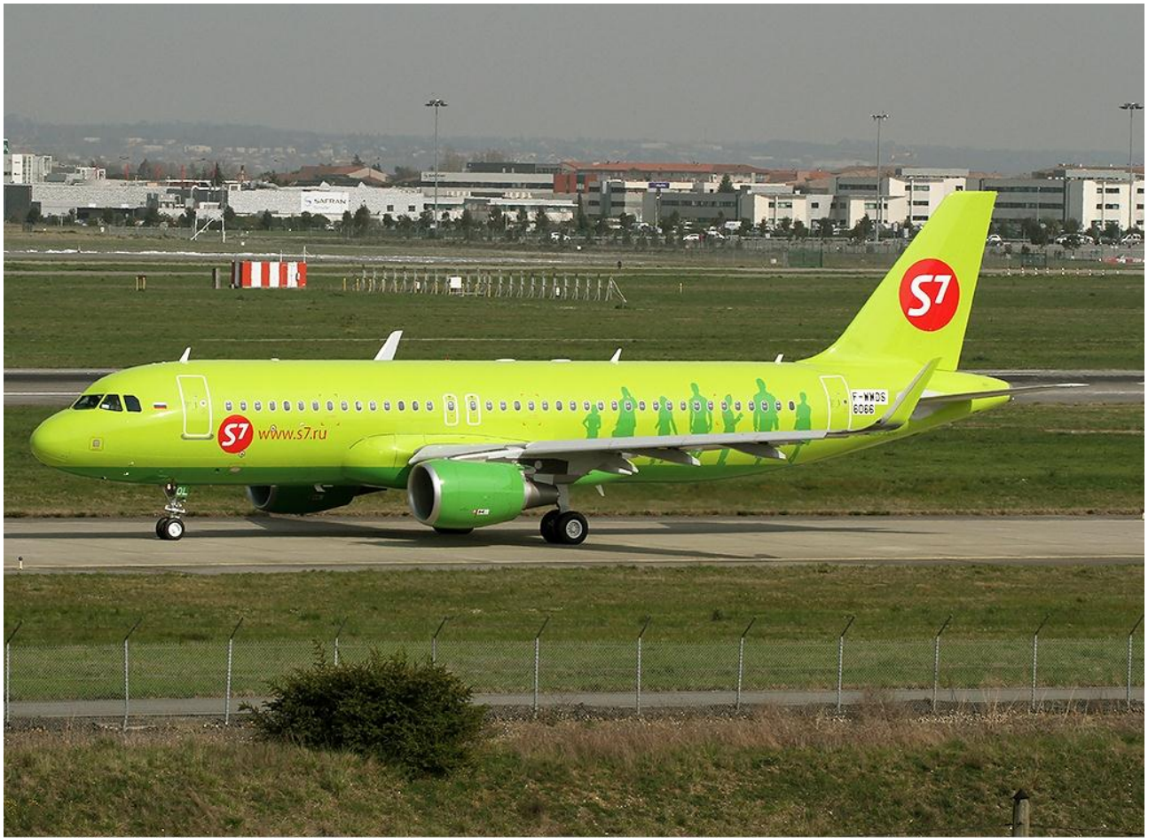
21-March-2014 | TLS | 1395459054