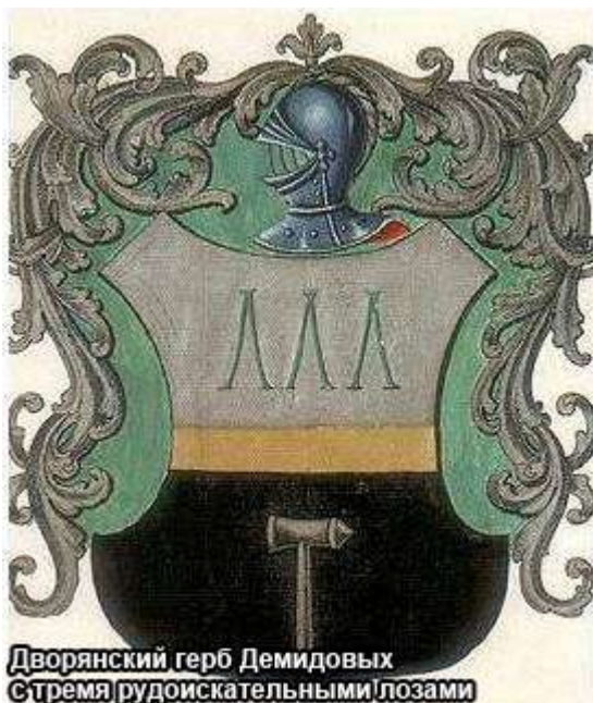
Дворянский герб Демидовых Стремя рудоискательными лозами

А комиссия по борьбе с «лженаукой» все больше словом, словом... отстаивает «передовые» рубежи. В Интернете – сотни статей с тезисом «биолокация – лженаука» настрогали. Но вот Демидовы, имени которых уважаемые академики премии получают, считали наоборот: лозоходство – очень полезное ремесло. Не зря на гербе лозы помещены выше молота – символа материального производства. Не виноваты лозоходцы древние и современные, что в Академии наук не хватило