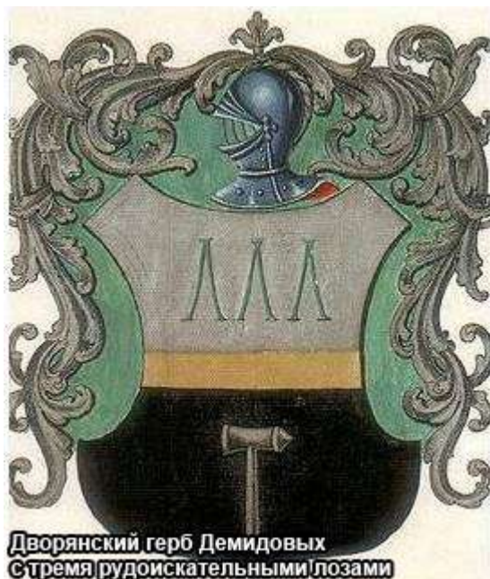
Дворянский герб Демидовых Стремя рудоискательными лозами

А комиссия по борьбе с «лженаукой» все больше словом, словом... отстаивает «передовые» рубежи. В Интернете – сотни статей с тезисом «биолокация – лженаука» настрогали. Но вот Демидовы, имени которых уважаемые академики премии получают, считали наоборот: лозоходство – очень полезное ремесло. Не зря на гербе лозы помещены выше молота – символа материального производства. Не виноваты лозоходцы древние и современные, что в Академии наук не хватило