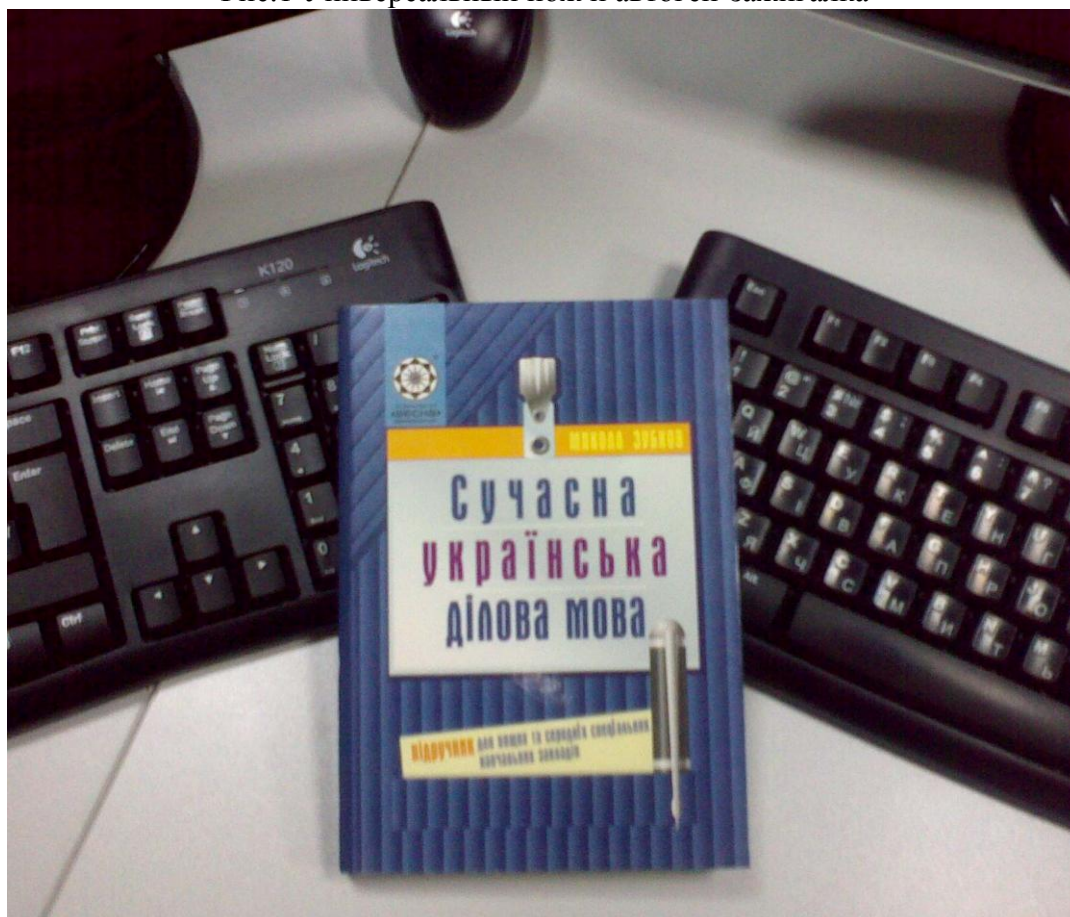
Рис.2 Книга с образцами нормативных с образцами бланков для внутренней и внешней документации, что поспособствует стандартизации новой документации.