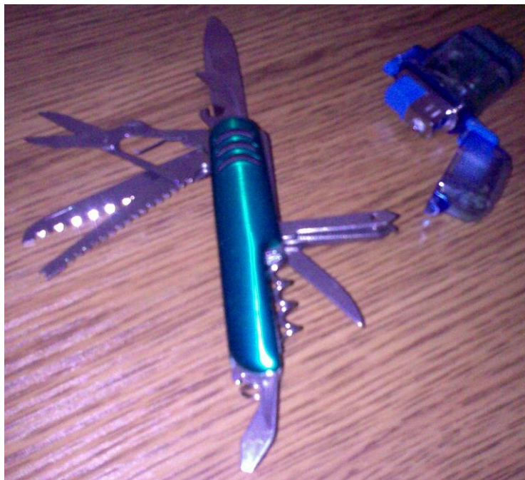
Рис.1 Универсальный нож и автоген-зажигалка