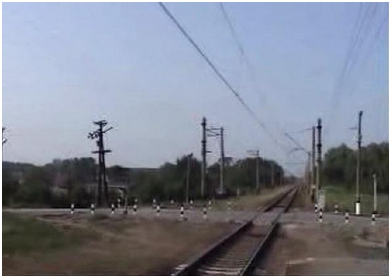
Злополучный железнодорожный переезд.

Из вышеперечисленных фактов остаются не объяснимыми действия водителя «Жигули», который игнорируя все визуальные и сигнализирующие знаки безопасности, неожиданно выезжает на железнодорожное полотно перед подъезжающим составом и наблюдает за сигнализирующим машинистом, не пытаясь выбежать из машины вместе с пассажирами. Такое поведение пассажиров может указывать на влияние на них неустановленных сил, которые могли умышленно воздействовать как на психику людей, так и на транспорт. Также в расследовании ДТП об обнаружении в крови водителя алкоголя не упоминалось.