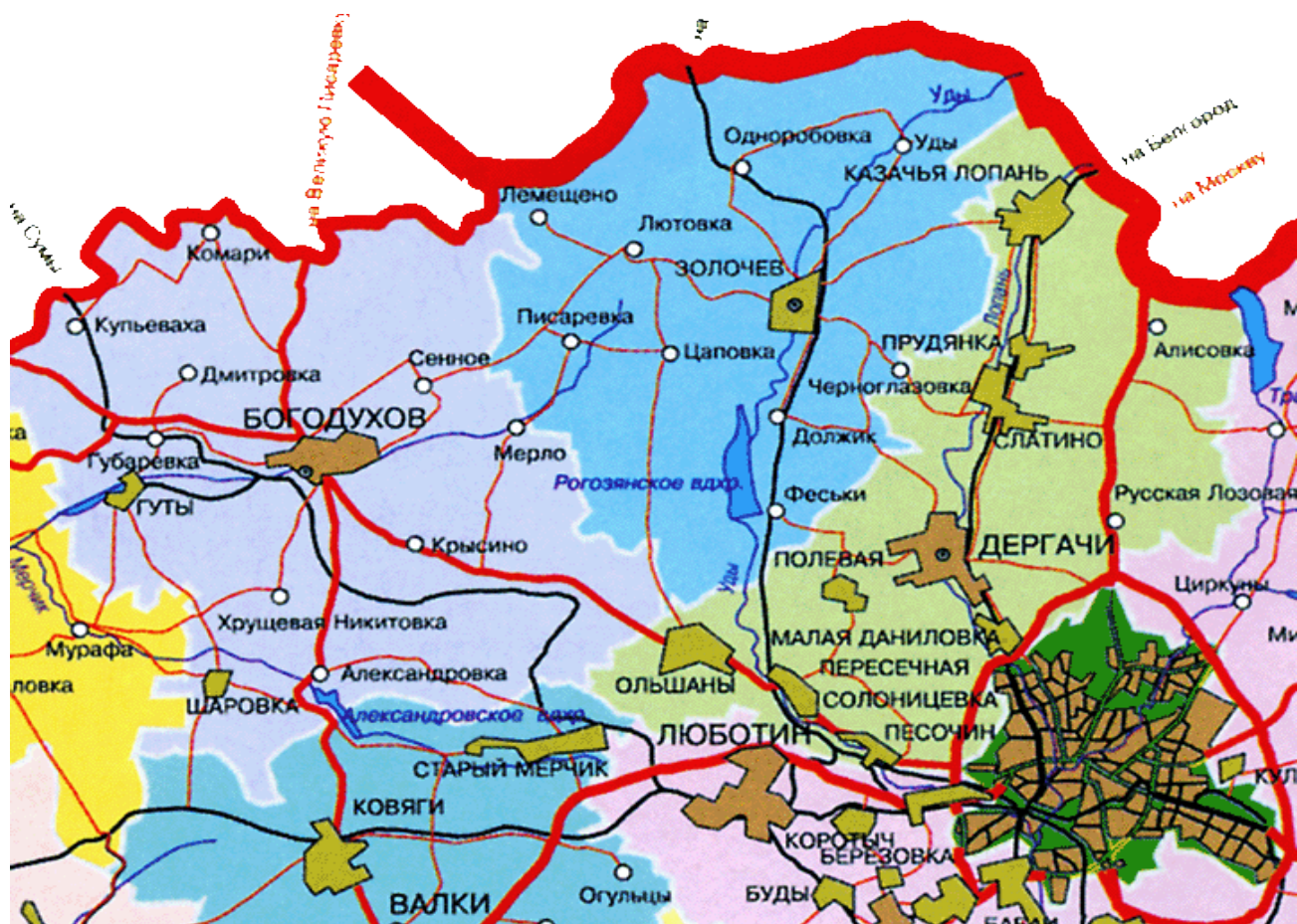
Золочевский р-он Харьковской обл.