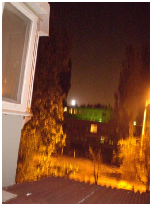
Рис.1. 05.09.2008 НЛО над Борщаговкой (Киев)

В течении лета – начала осени УНДЦА «Зонд» был получен ряд свидетельств от очевидцев относительно наблюдаемых ими неотожествленных летательных объектов. Некоторые наиболее интересные материалы, приводятся ниже: