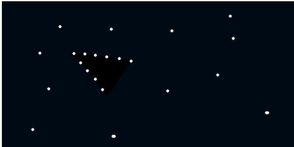
Рис.2. над Троещиной (Киев)