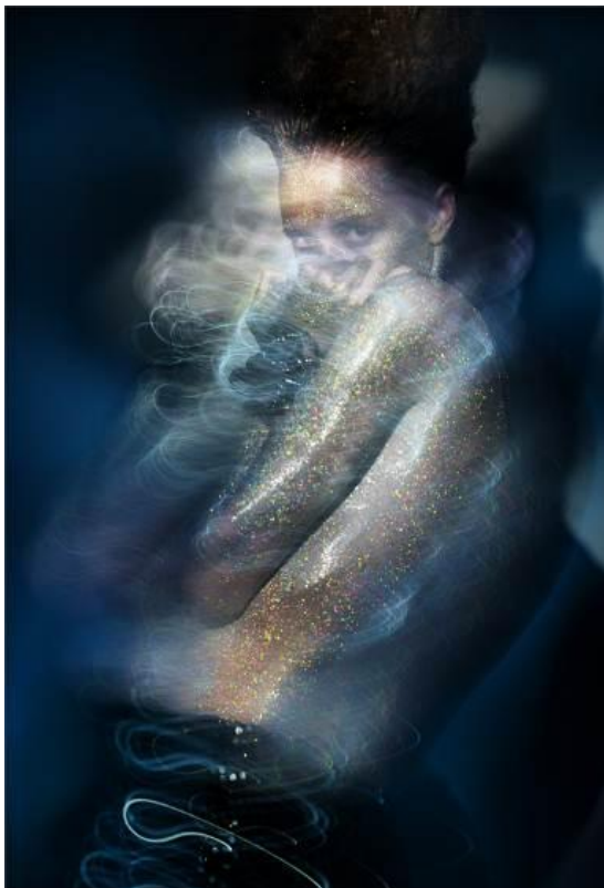
Рис.2. Аналог эффекта, на фото очевидицы, полученный в фотостудии с моделью

На Ваш взгляд, это действительно фото какого то аномального объекта? Опасно ли его сохранять? Может ли какой то вред нанести?» Был произведен анализ фото, найдены аналоги получаемых эффектов (рис.2).