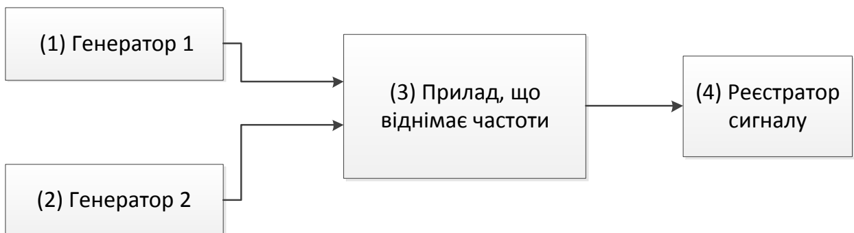
Фіг. 1. Прилад для реєстрації інформації, що передається за допомогою квантової сплутаності

В основу корисної моделі поставлено задачу організації безконтактного інтерфейсу людина – комп'ютер, який є незалежним від відстані між ними. Технічним результатом є можливість керування різними пристроями лише силою думки, оцінка емоційного стану людини, дослідження «аномальних» зон.