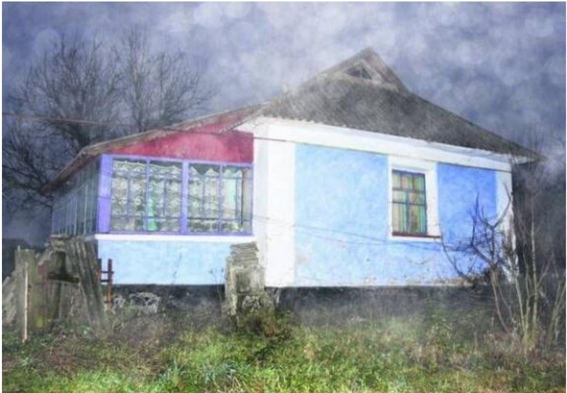
Будинок родини Беренд у селі Томашівка Ярмолинецького району Хмельницької області. Сім'я прожила тут 45 років і виїхала. Хати поряд теж пустують