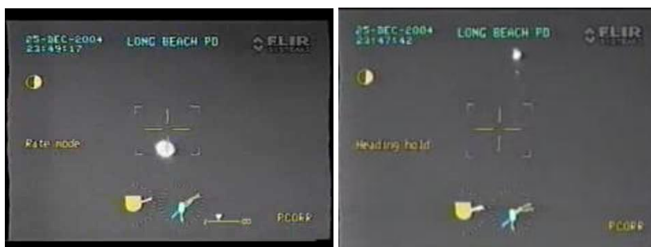
Рис.1. Кадр из видео

Высказаны возможные гипотезы относительно природы происхождения данного объекта.