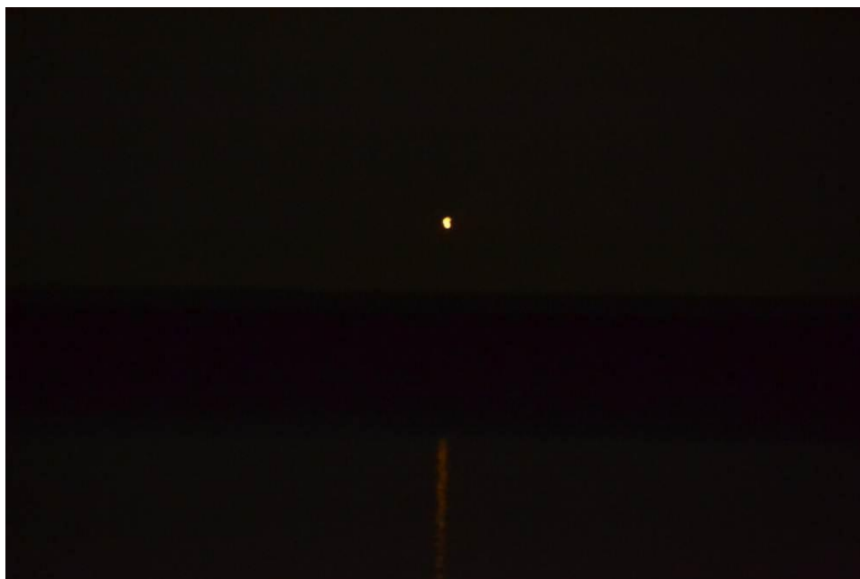
Рис. 1. Объект над водохранилищем (снимок очевидца)