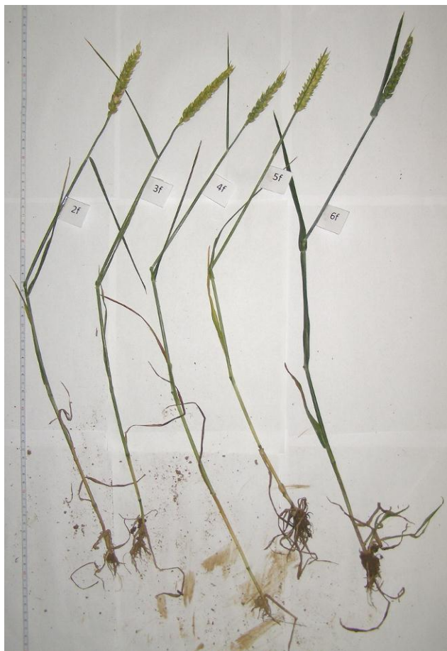
Рис.4. Пагони з формації

Визначено, що формації утворюють складний візерунок між колями для сільгосптехніки з восьми кіл діаметром від 4 до 12 м. Характерно, що у семи колах посередині знаходиться отвір діаметром 2..2.5 см та початковою глибиною 25 см, з яких ґрунт був вилучений.