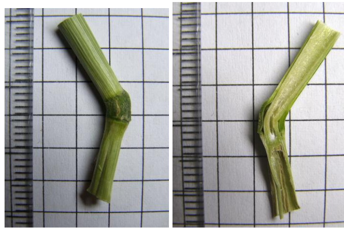
Рис.6. Вузол стебла пшениці з формації

Між тим зарано робити глибокі висновки щодо механізму утворення та причини походження формацій. Якщо вони виникають не в результаті діяльності відомих людських технологій, а вочевидь так і є в даному випадку, то поле для гіпотез дуже широке. «Будь яку невідому технологію не відрізнити від магії» казав Артур Кларк. Тут ми маємо справу саме з таким випадком.