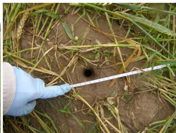
Рис.3. Отвір у центрі кола