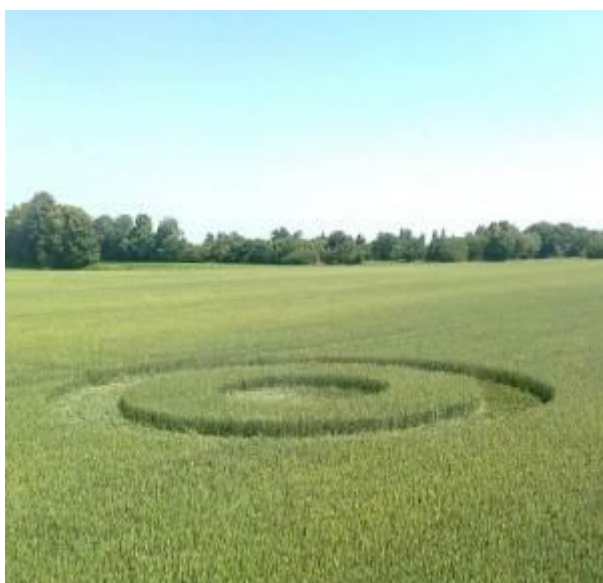
Рис.2. Одне з кіл