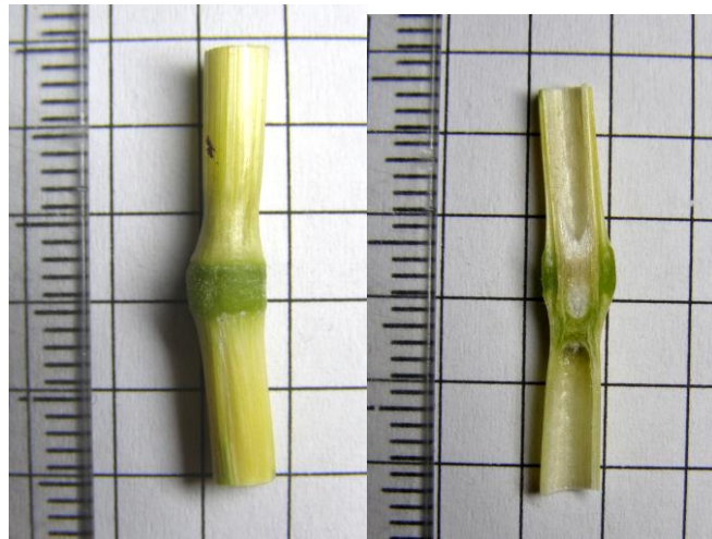
Рис.5. Вузол звичайного стебла пшениці