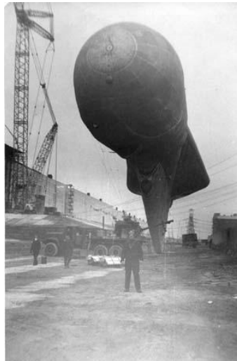
Рис.4. Дирижабль освещения в Чернобыле