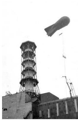
Рис.3. Дирижабль освещения в Чернобыле