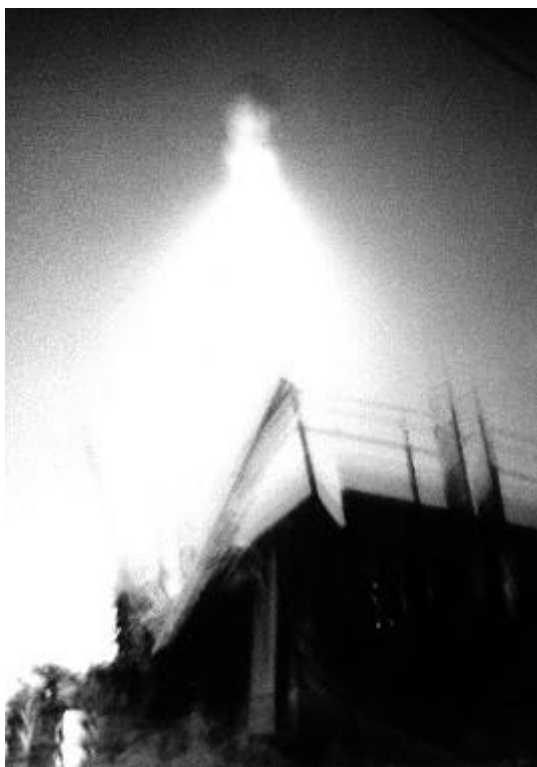
Рис.1. Дирижабль освещения в Армении

Это могут быть аэростаты освещения, которые в частности применялись во время проведения поисково-спасательных и восстановительных работ во время землетрясения в Армении а также во время ликвидации последствий аварии на Чернобыльской АЭС.