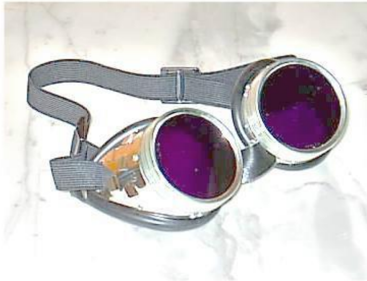
Рис.3. Окуляри Вальтера Кільнера через які ніби видно ауру і силові поля магнітів.