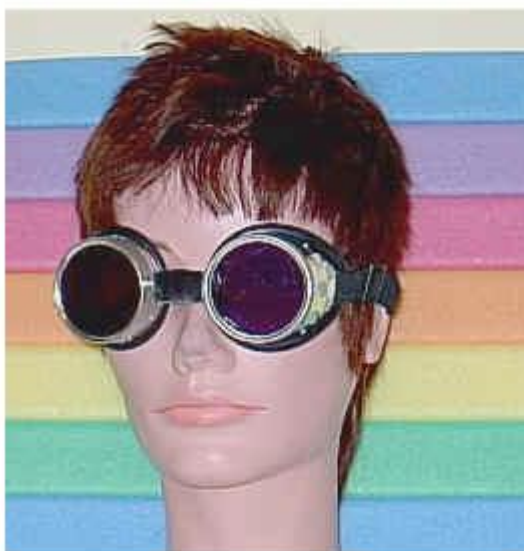
Рис.2. Окуляри Вальтера Кільнера через які ніби видно ауру і силові поля магнітів.