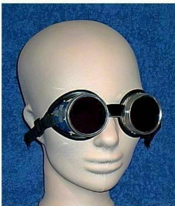
Рис.1. Окуляри Вальтера Кільнера через які ніби видно ауру і силові поля магнітів.

Ще мене цікавить активація ефіру звуком http://www.divinecosmos.e-puzzle.ru/2Chapter8.htm ».