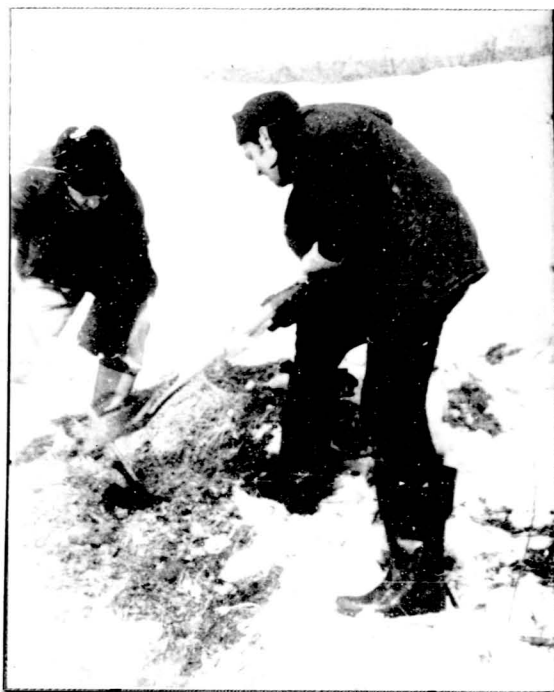
№2 Апрель 1989 г. Кorb-озеро. Зачистка борта ямы. Экспедиция ЛО ИЗМИР АН СССР под руководст- вом Горшкова Э.С.