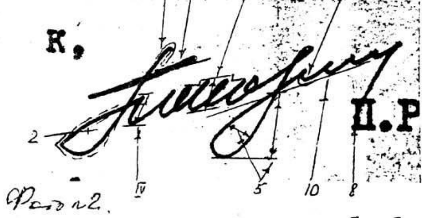
Рис. № 2.

Рис. № 1. Исследуемая надпись от имени Фомина Ф.Р. в номере № 507-С-4970 от 5.XII.91 г.