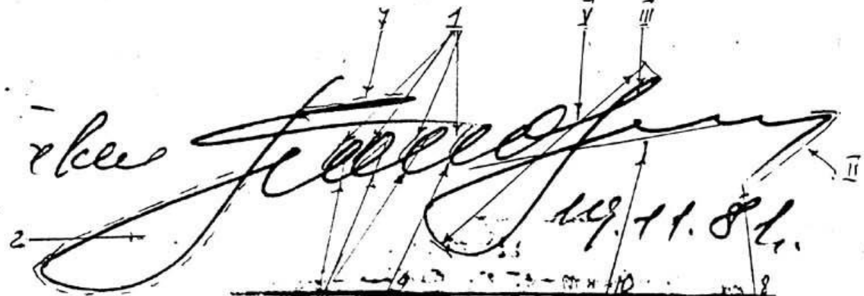
Рис. № 3. На дату № 243 свободной рукой подписан Александром Фоминым в номере № 507-С-4970 от 5.XII.91 г. Александром Фоминым, краем... (partially obscured text)