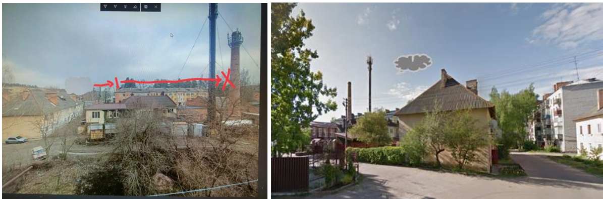
Рис.3. Схема руху об'єкту

Відео та фото немає, є тільки рис. очевидиці.