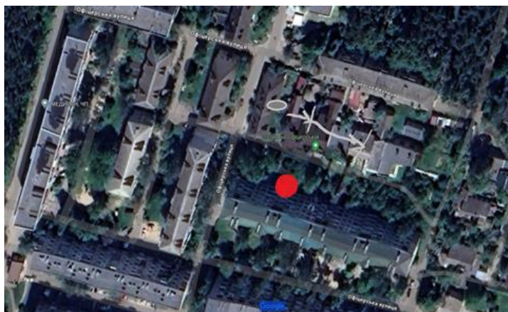
Рис.4. Місце спостереження і локації об'єкта

Фактори аномальності, за словами очевидиці, наступні: Суцільна тиша, ні звуку вулиці, вітру, машин, дерев, враження ніби вакуум усе поглинув, також все не рухалося, ніби завмерло, застигло.