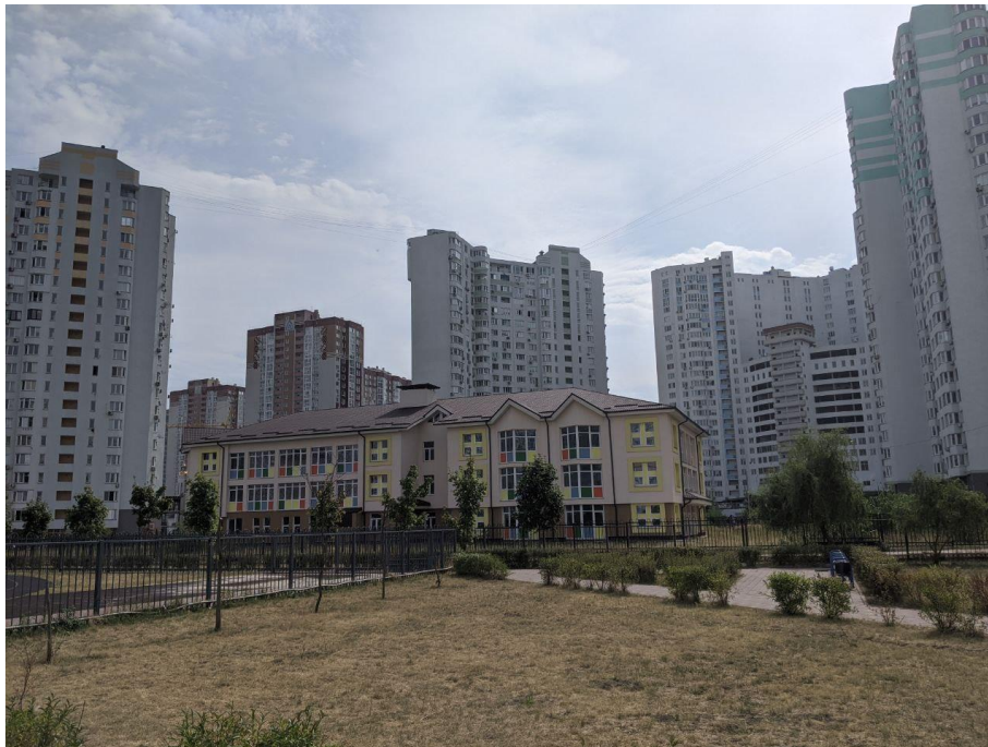
Рис.2. Місце із якого проводилося спостереження

через 2-3 секунды такого полета, скорость была равномерная, без ускорений, они начали расходиться, мне сложно сказать какая точка куда, но мне кажется, что левая начала уходить быстро влево и отставать, они разошлись на 50-70мм, не меняя яркость все это происходило. правая, казалось, летела так же прямо. потом они зашли за дом, к тому же там было полнолуние и они пропали в свете луны и за домом. при этом скорость не менялась угловая. звука не было".