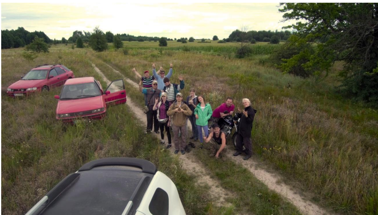
Рис. 4. Спільне фото з експедиції 2-8-20

ПОСТАНОВИЛИ: вважати експедицію успішною, як і проект цілому. Результати ретельно обробити із залученням програмних продуктів та інструментів статистики.