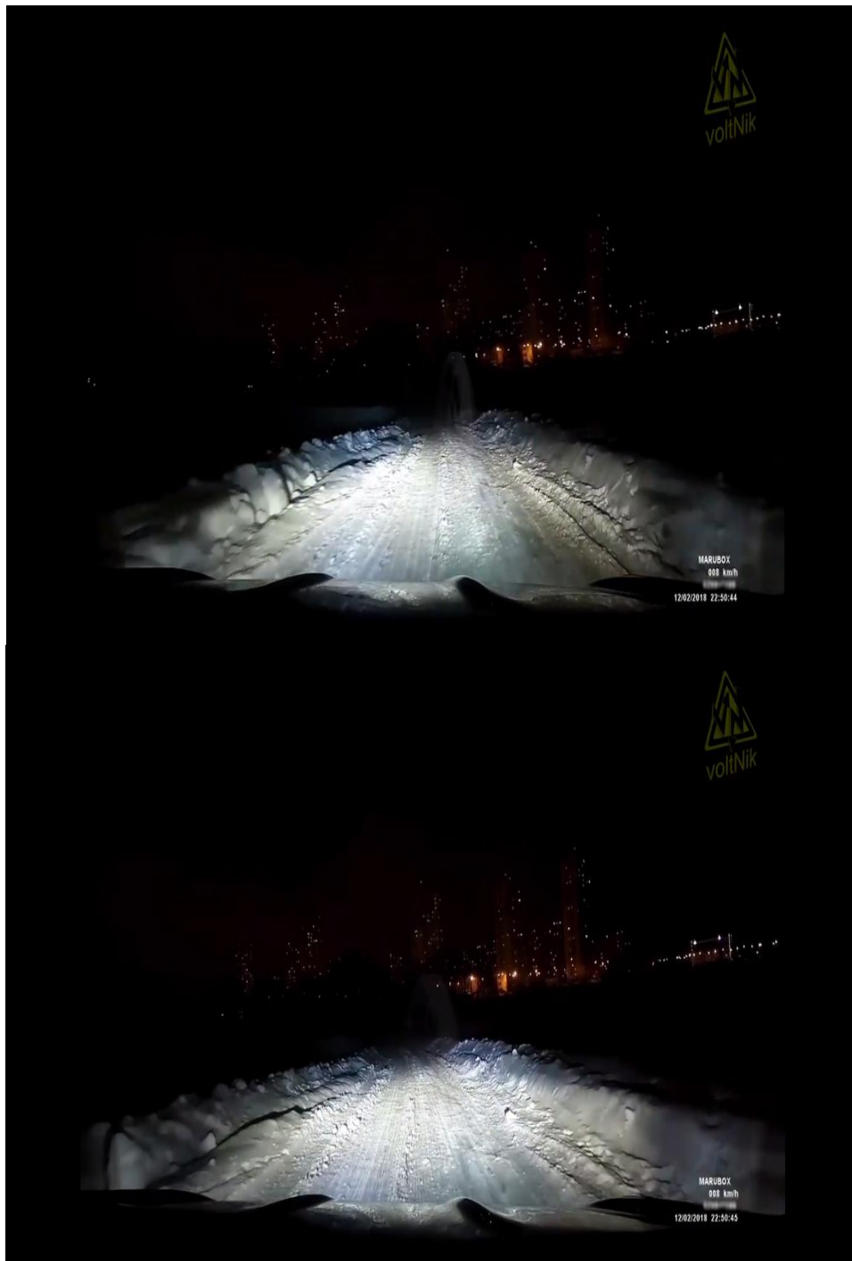
Рис.3. Фото явища знятого на відеореєстратор.

ПОСТАНОВИЛИ: Прийняти до відома, враховувати при ототожненні подібних явищ.