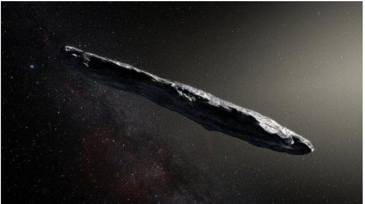
Рис.2 Візуальне уявне представлення астероїда

Швидкість і траєкторія об'єкта, який виявили 19 жовтня, вказували на те, що він виник у планетній системі навколо іншої зірки, пише редактор відділу "Наука" BBC News Пол Рінкон.