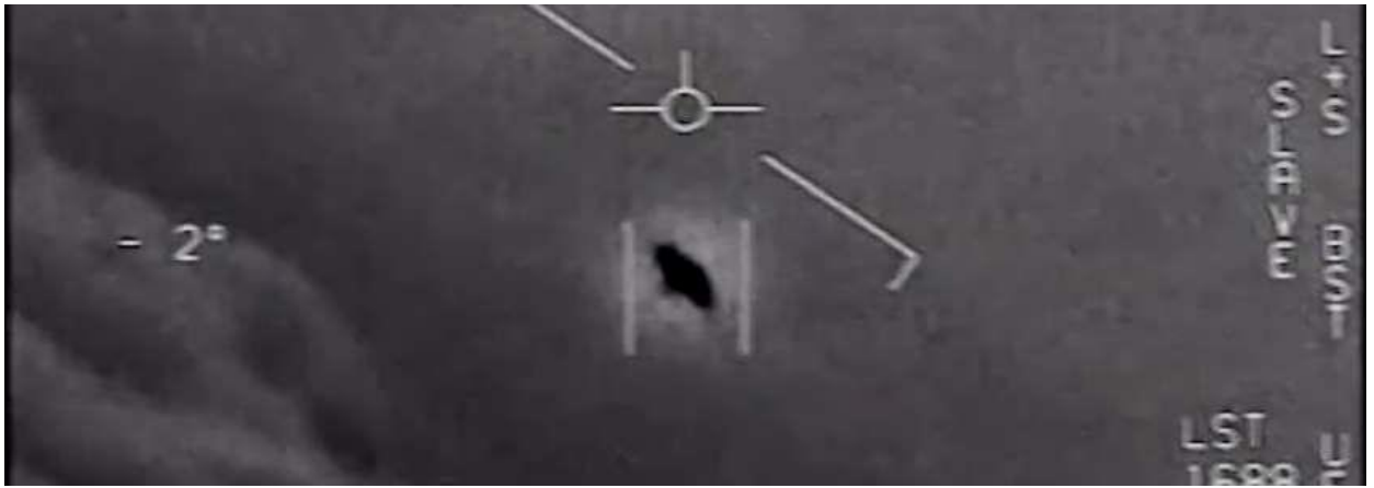
Рис. 5. Скріншот із відео

Доступні два відео проглянути учасниками Центру.