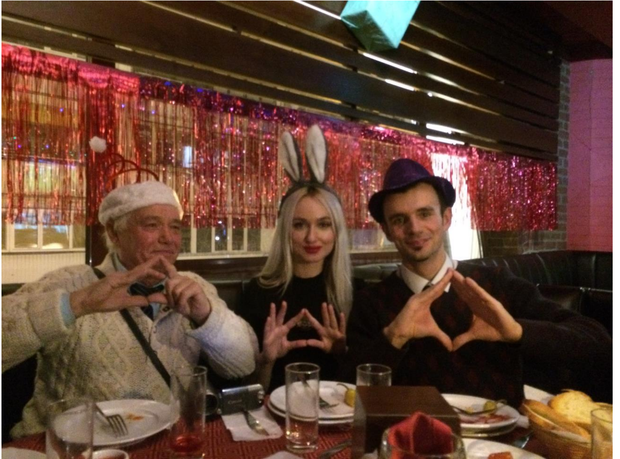
Рис. 6. УНДЦА «Зонд» бажає усвідомленості, наукових відкриттів та здоров'я у Новому році!