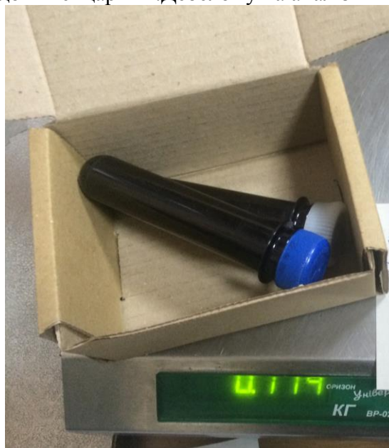
Рис.1 Колби із матеріалом

Згідно із попередніми рішеннями УНДЦА відправлено на аналіз шерсть невідомих істот із випадку «Орестів-2010» до Швейцарії М.Дебелому на аналіз