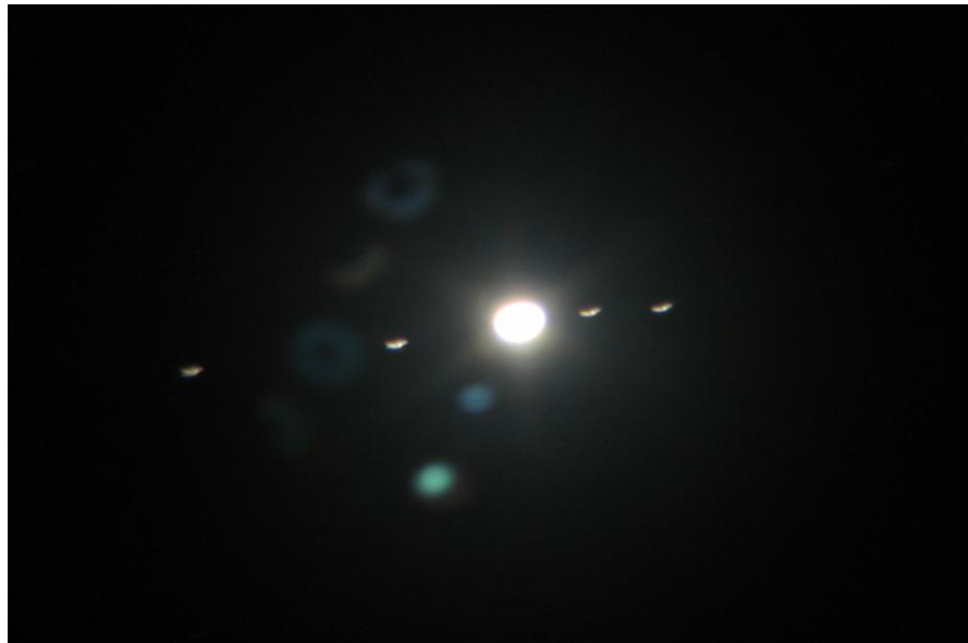
Рис.3. Аналог фото.