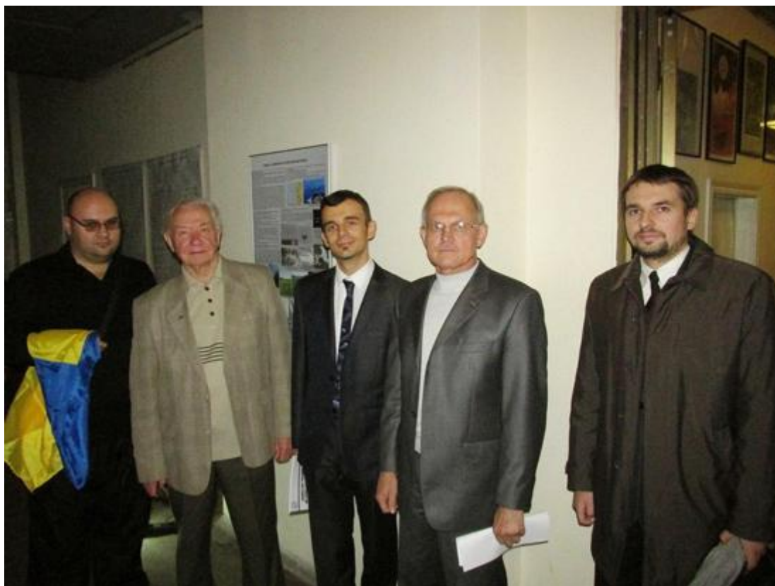
Рис.1. Відкриття стенду

У редколегію і авторський колектив збірника увійшли провідні вчені, як з України, так і зі США, Австрії, Нідерландів, Іспанії та інших країн.